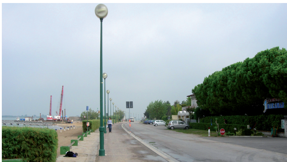
L'entrata del camping Miramare sul lungomare D. Alighieri, a Punta Sabbioni-Cavallino: nel 2004 possedeva ancora un accesso all'acqua per calare piccole imbarcazioni.

21 darsene coinvolte nel monitoraggio sul diportismo.