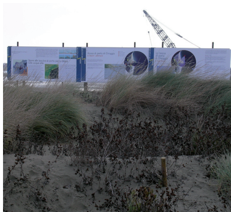
Cartellonistica relativa ai lavori alle bocche, presso l'oasi LIPU di Ca' Roman.

In conclusione, i risultati del piano di monitoraggio relativo al comparto turistico possono essere così sintetizzati: